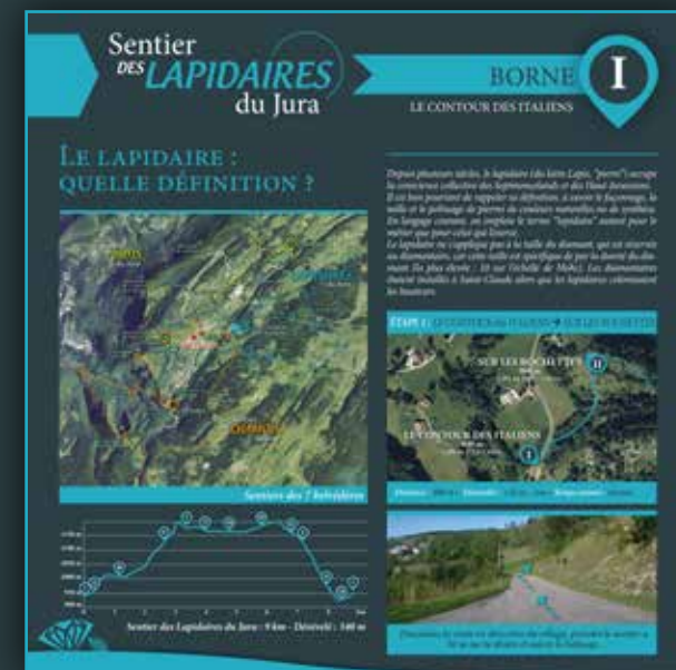
Exemple de borne pédagogique