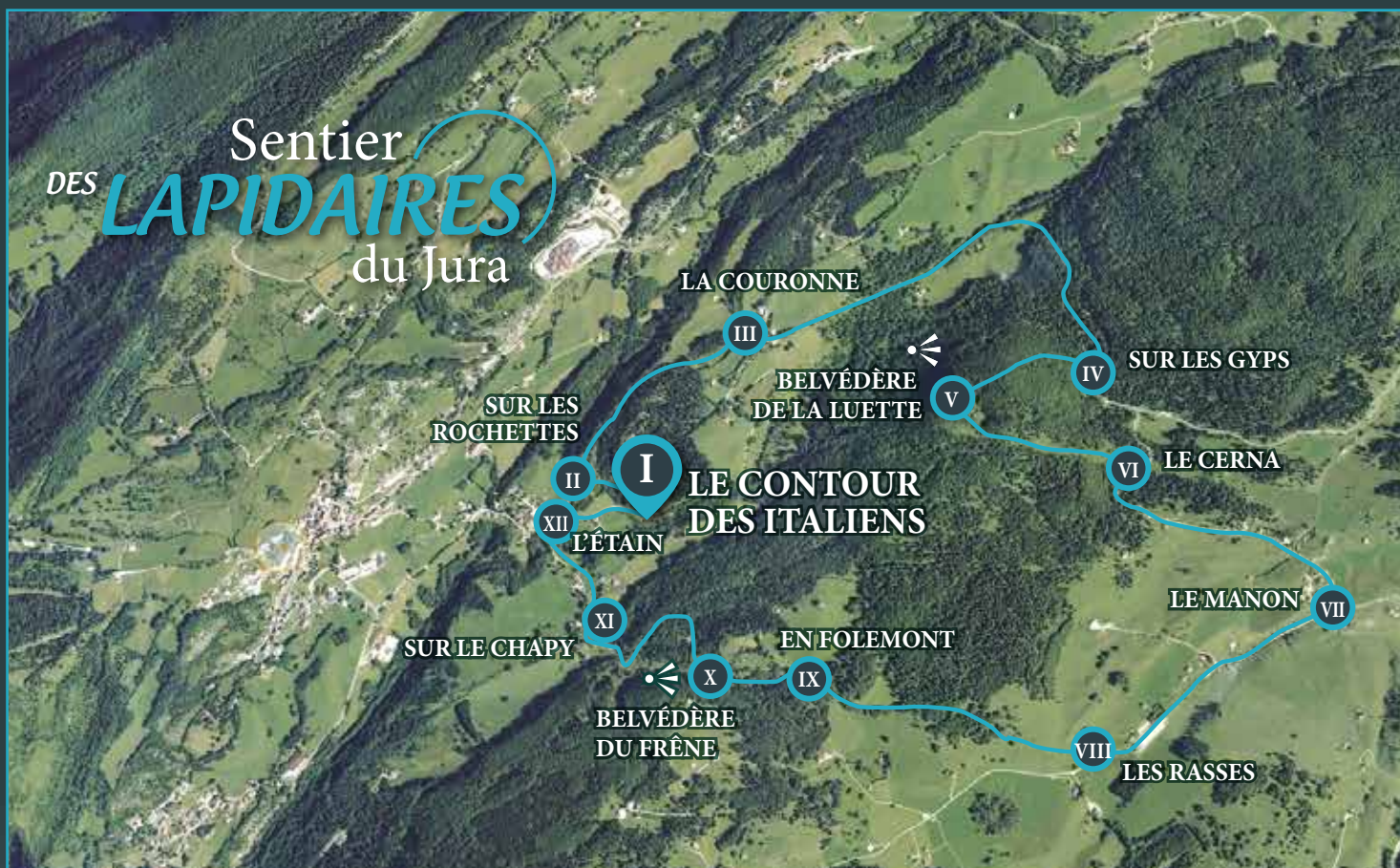
Parcours complet du sentier des Lapidaires du Jura